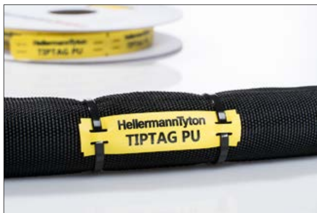
Holdbar merking for krevende omgivelser.